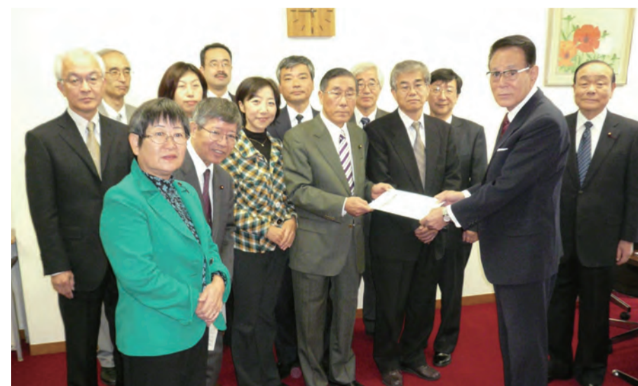
花川区長に予算要望書を提出する日本共産党北区委議員団 (2010年11月)