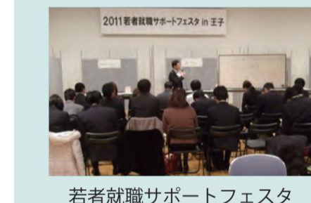
若者就職サポートフェスタ