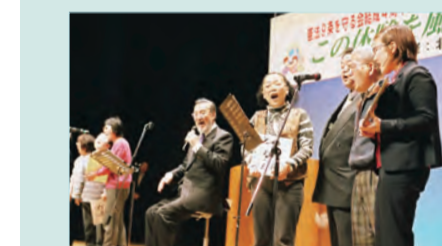
9条の会講演会(2009年3月)

保育園に入れない子どもの問題は深刻です。日本共産党は「待機児解消は認可保育園の増設で」と求め、新年度にむけて認可園6園の新設など362人の定員増を実現させました。