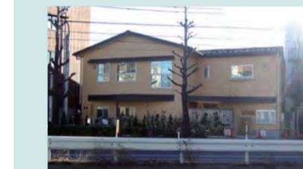
この春開園の「つちっこ保育園」

就職できない新卒者などに仕事をあっせんし、区内中小企業などへの正規雇用につなげる若者就職応援事業がスタート。日本共産党の提案で、本腰を入れた雇用対策がすすみました。