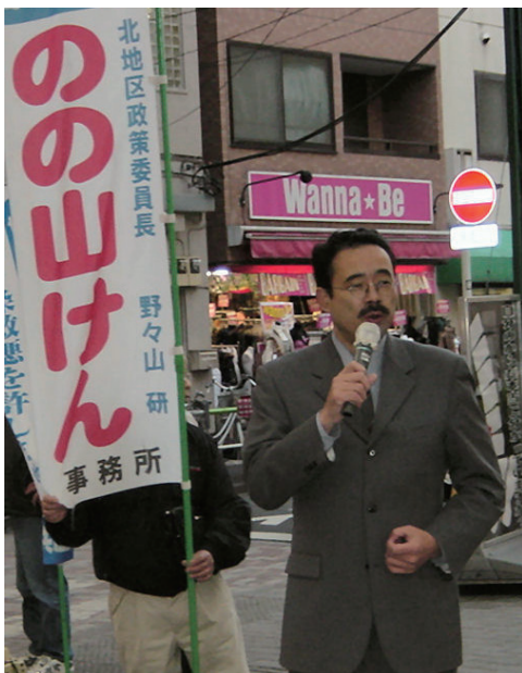
LaLa ガーデンで街頭宣伝 (12月23日)