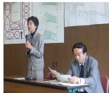
説明をおこなう区の職員