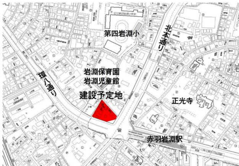
高さ70m、北区で最大の高さの建物に（図は説明会での資料より）

赤羽岩淵駅前に、22階建て地上70mの超高層マンションを建設する計画が明らかになりました。建主は住友不動産で、来年1月中旬から着工としていますが、先に開かれた住民むけ説明会では、風害、地盤の弱さ、子どもへの影響など、不安の声が相次ぎました。