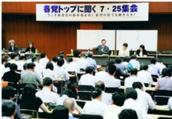
「各党トップに聞く7・25集会」で発言する志位和夫委員長 7月25日・総評会館

集会を主催したのは、全国ユニオンなどで作る「格差是正と派遣法改正を実現する連絡会」。厚労省や与党が、日雇い派遣の原則禁止を盛り込んだ労働者派遣法改正案をまとめるなどの動きが伝えられるなか、臨時国会で抜本改