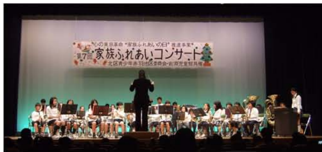
岩淵小学校スクールバンドの演奏 6日、赤羽会館