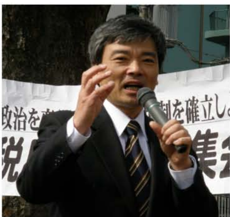
重税反対北区民集会であいさつする、 そねははじめ都議会議員 3月13日 王子三角公園

石原都政で最も冷酷な切り捨てが行われたのが高齢者福祉です。老人医療費助成、無料シルバーパス、老人福祉手