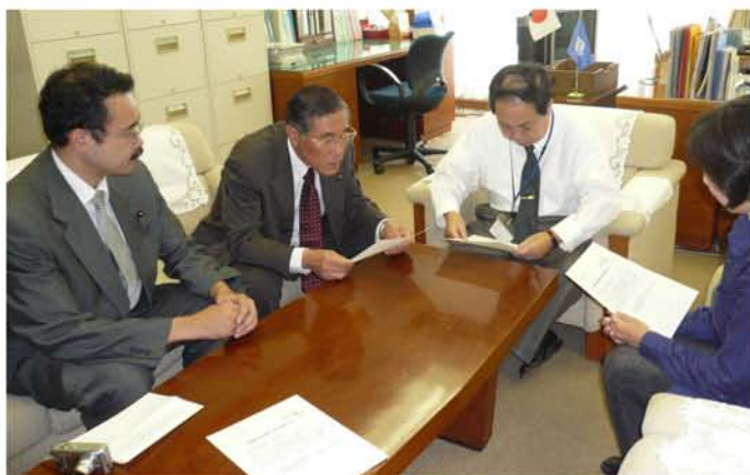
申し入れる日本共産党北区議員団 23日、北区役所

空き、冷却水が大量に漏れる事故が起きました。10月には、建設されたばかりの王子区民センターにおいてエレベーター内の閉じこめ事故が発生。さらに今月20日には、区立特別養護老人ホームの業務用エレベーターで配膳作業中のボランティア女性が落下するという人身事故が発生しました。