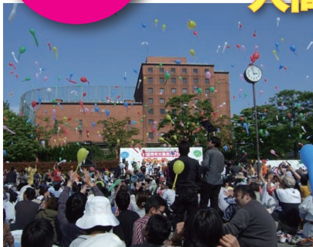
風船を打ち上げ、アピール採択を意思表示

5月16日、明治公園で全国青年大集会（主催・同実行委員会）が開かれ、私も、北区の青年とともに、赤羽からの直行バスで参加しました。 暑い日差しの下、全国から5200人も働く青年らが集い、分科会を終わってメイン集会が始まる頃には会場がいつぱいになりました。 前回の集会（08年10月）以降も、偽装請負や派遣切りなど青年を「使い捨て」にしてきた大企業などに対し、全国各地でたかひの渦が巻き起こっています