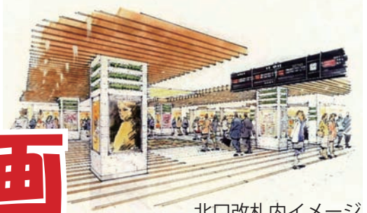
北口改札内イメージ

JR東日本はこのたび、赤羽駅高架下リニューアル計画を発表しました。「地域活性化」「駅の利便性向上」「日々の暮らしを楽しく」をコンセプトに、①ラチ外駅ビルを北ラチ内コンコースにする、②南ラチ外コンコース向けに店舗を設置する、などの改修をおこなう計画です（下図参照）。 南口改札前の店舗は7月31日をもってすでに閉店していますが、JRによれば11月から北口ラチ内工事を開始し、来年3月に既存コンコース部の改良（I期工事）、来年6月までに同コンコース部拡充、エスカレーター新設（II期工事）をおこなうとしています。 詳細については検討中とされていますが、すでに東口および西口の商店会むけに説明会がおこなわれ、今後、区議会にも計画の詳細が報告される予定です。