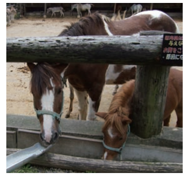
牧場の愛くるしい動物たち

動。私は、九尾の狐が逃げ込み、石になったと伝わる殺生石を見にゆきました。硫化水素、亜硫酸ガスなどの異臭に少し頭もくらぐらし、早々に引き返しました。