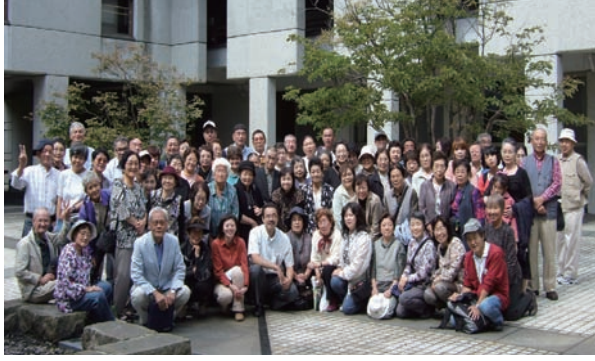
北区しらかば荘の中庭で参加者全員の記念撮影