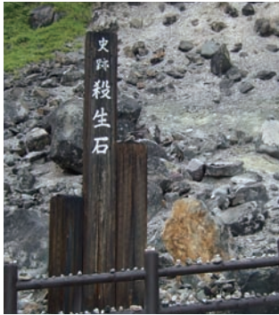
異臭たちこめる殺生石