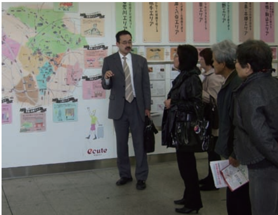
日暮里駅構内を視察する、のの山区議（中央）と地域住民

JR東日本は、2005年から関東周辺の駅開発をおこなっています。すでに、大宮、品川、立川、日暮里、東京の各駅で「ecute」（エキュート）という名称の商業施設がオープン。赤羽駅では、来年6月までの改修工事をうけ、「ecute 赤羽」が開業する見通しです。