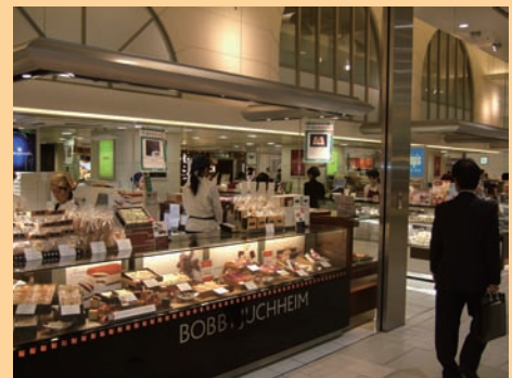
ecute 大宮 デパ地下を思わせる大規模なエキナカ。雑貨からスイーツまで必要なものが何でも揃っている。