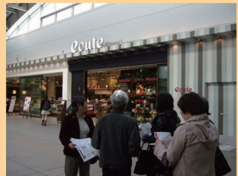
ecute 日暮里 JRと京成線を結ぶ動線脇に小ぢんまりとした商店街が。女性客の姿が目立っていた。