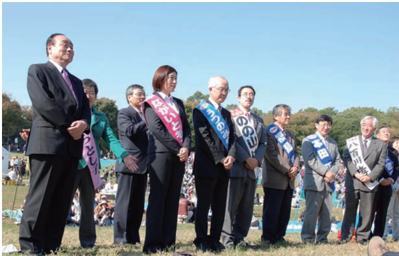
勢ぞろいした9人の日本共産党区議会議員予定候補者