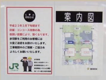
赤羽駅構内に貼り出された「案内図」

23日、赤羽駅改修問題の参考として、都内3カ所（品川、東京、立川）の「エキナカ商店街」を再視察しました。また、工事中の赤羽駅北口構内には、改修中であることをしめす「案内図」が掲示されていました。（のの山けん）