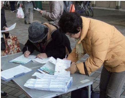
北区社保協の国保料値上げ反対署名行動 = 2月7日、ララガーデン

審査では、算定方式変更反対（1項）と、国保料を値上げしないようあらゆる努力を講じる（2項）項目について日本共産党と新社会党が採択を主張しましたが、自民、公明、民主（社民含む）が不採択を主張。反対多数で不採択となりました。