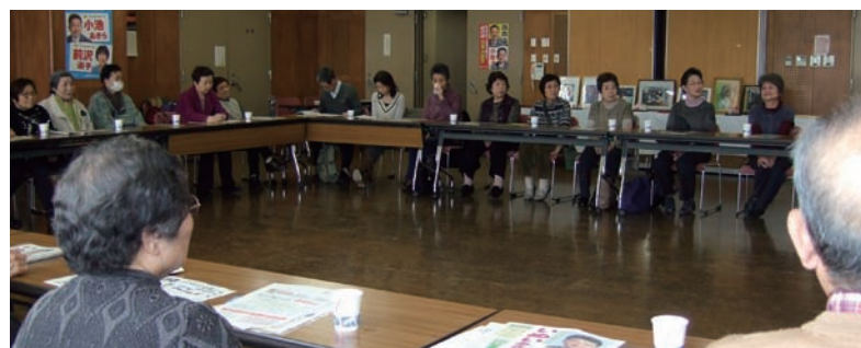
弁士の訴えに耳を傾ける参加者 = 6日、志茂東ふれあい館

北区で、高齢福祉予算は23区中17位だとのべ、「北区がためこんでいる445億円の積立金の一部をとりくずせば、抜本的な高齢者対策がすすみます。9人の日本共産党北区議員団は、衆議院になおせば100議席に匹敵する力で、特養ホームの待機者ゼロ、地域包括支援センターの職員倍加、24時間の高齢者見守りシステムの実現にむけて全力をあげます」と決意を表明しました。また、JR赤羽駅の改修問題や赤羽公園の遊具撤去をめぐる問題についてくわしく報告し、「どんな問題でも住民のみなさんの声を大切にし、区民の声で区政を動かしてゆきます」と訴えました。参加者からは、「テレビで『老人のネットカフェ』をとりあげ報道して