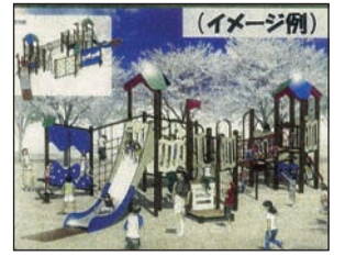
コンビネーション遊具 新設