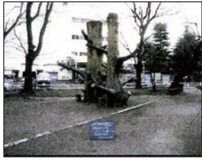
コンクリートの木 撤去