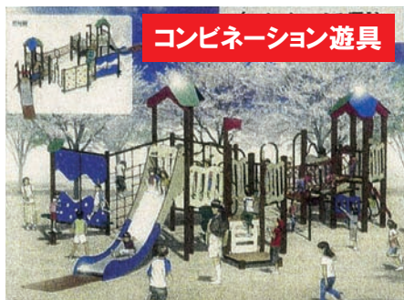
コンビネーション遊具

安全性に問題があるとして撤去が検討されていた赤羽公園の遊具について、北区はこのほど、改修案をしめしました。 第1の案は、「大空の門」（アーチ型滑り台）の撤去・少し小さめの「キリンの滑り台」の新設（復活）・「幅広滑り台」の改修、第2の案は、「大空の門」の撤去・「コンビネーション遊具」の新設・「幅広滑り台」の撤去、第3の案は、「幅広滑り台」の改修・「大空の門」をモニュメントと