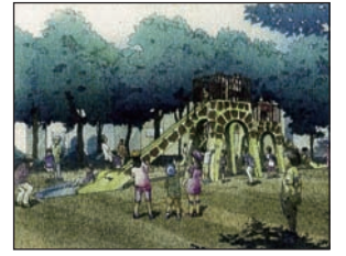
キリンの滑り台 新設