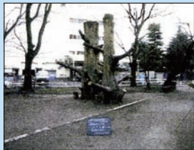
コンクリートの木 撤去

赤羽公園の遊具について、北区がおこなったアンケートの集計結果が、このほどまとまりました。アンケートは、キリンの滑り台を復活させる案（選択肢①）、コンビネーション遊具を新設する案（選択肢②）、「大空の門」をミニメントとして残す案（選択肢③）から1つを選ぶ形式。近隣の小学校、保育園、幼稚園などから1928人の回答があり、選択肢②を選んだ人が54%でした。 区は、7月1日に住民説明会を開催し、今後の方針について意見交換をおこなうとしています。