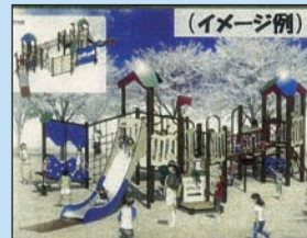
コンビネーション遊具 新設