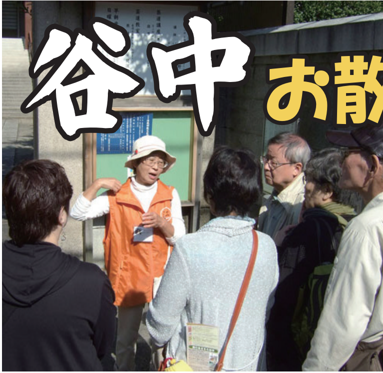
台東区の観光ガイドさんの説明に聞き入るお散歩ツアー参加者