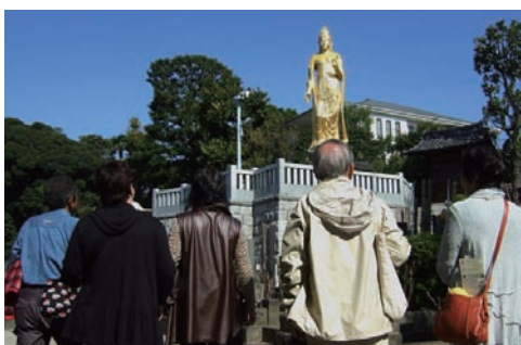
全生庵の観音像を見上げる参加者