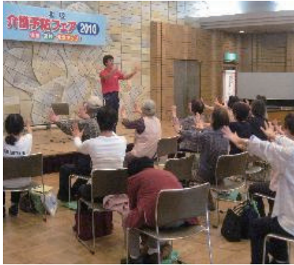
介護予防フェア2010 (北区HPより)

介護保険制度は、今年度で第4期が終了、2012年度からの3年間が第5期事業計画となります。このほど北区第5期事業計画についての公聴会が、3会場で開かれました。 認知症対策、医療・介護連携を 新しい計画では改正介護保険制度をうけて認知症対策と医療・介護連携の強化を重点化、地域包括支援センターを中心に、医師会・