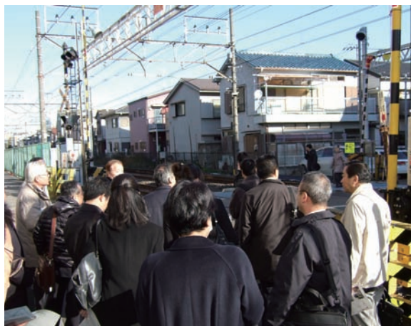
地域開発特別委員会の視察