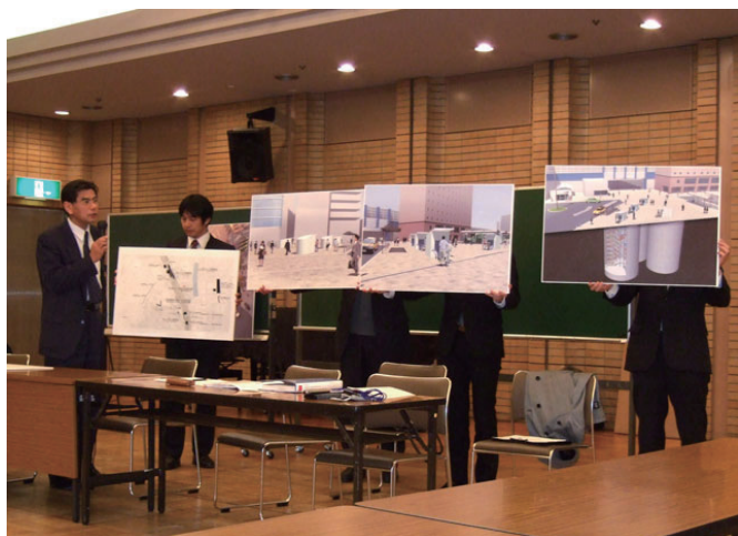
まちづくり協議会で、赤羽駅東口駅前の地下式自転車駐輪場建設計画について説明する区の担当者。

16日に赤羽会館で開かれた赤羽駅東口地区まちづくり全体協議会総会で、赤羽駅東口駅前の地下式自転車駐輪場建設計画が明らかにされました。