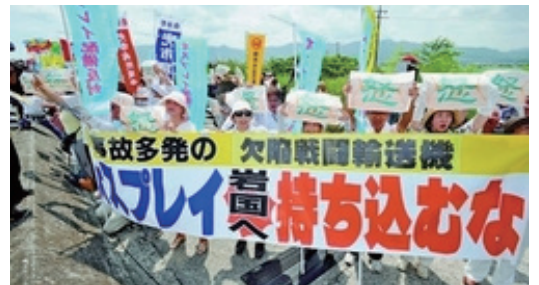
陸揚げに抗議する人たち = 23日、岩国市

23日、山口県岩国市の米海兵隊岩国基地で、墜落事故が相次いでいる垂直離着陸機M V22オスプレイの陸揚げが強行されました。基地の前では、陸揚げに抗議する「人間の鎖」が築かれました。山口県知事、岩国市長と市議会が反対し、沖縄でも県と全市町村の首長と議会が反対、全国知事会も受け入れ反対の緊急決議を採択しているなかでの陸揚