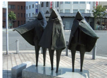
宇部市内には街角に数々の彫刻が

今年度から来年度にかけては、再生可能エネルギー導入促進事業として、市民共同発電の仕組みづくりを推進しています。これは、市民と企業、NPOなどからの出資を募ってファンドを設立し、公共施設に再生可能エネルギーを導入、この電力を売電した収入で、出資