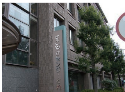
視察した「すこやかセンターくれ」

そこで、本人の負担軽減と医療費の削減をはかるために、2008年度から「レセプトデータベースシステム」を導入して、医薬品の使用頻度の高い国保加入者へのジェネリック医薬品の促進通知サービスを開始。これによって2012年3月までに通知者の