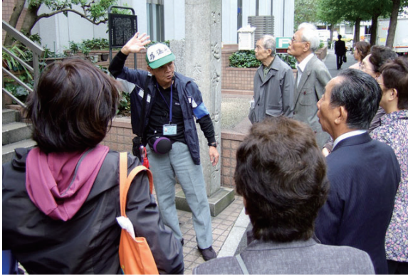
中央区のボランティアガイドの説明を聞く参加者

23日、日本共産党志茂・赤羽後援会の下町散策に参加しました。今回は、日本橋界隈です。 日本橋といえは五街道の起点、まさに江戸時代の、商業、経済、文化の中心地にあたります。 参加者15人は午前10時、赤羽駅に集合し、京浜東北線で東京駅へ。八重洲口から少し歩くと日本橋