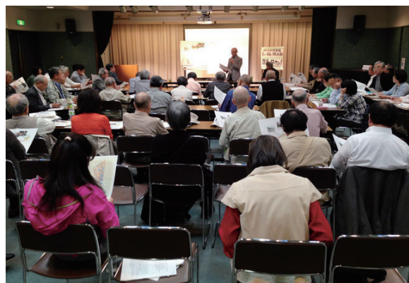
それぞれの地元で運動にとりくむ住民同士が交流

路の幅を広くすることは延焼遮断に役立たないことはないが、莫大な予算をかけ、そこに居住する住民を立ち退かせてまで整備する必要があるかどうかは、疑問だということです。