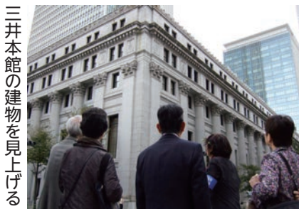
三井本館の建物を見上げる

ビルと化し、昔の名残りはありません。ビルの谷間に、ところどころ、高札場や迷子しらせ石柱などがひっそり顔を出しています。日本銀行に隣接する貨幣博物館を見学した後、三井本館、三越デパートを眺めながら、日本橋付近をぐるっと一周。橋のたもとにある魚河岸跡で解散となりました。 昔の名残りなく 高層ビル街に