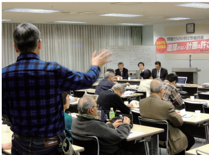
党議員団主催の緊急学習交流集会 =22日、北とびあ第2研修室

日本共産党北区議員団は22日、北とびあで特定整備路線問題を考える緊急学習交流集会「道理のない計画は許さない」を開きました。区内外から52人が参加しました。