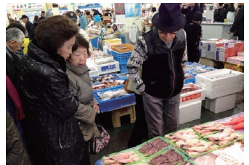
那珂湊おさかな市場で買い物

う参加者の方もいました が、バスで境内そばまで 登りつき、ひと安心でし た。参拝している間にも 寒風が吹きすさび、そそ くさとバスへ戻ります。