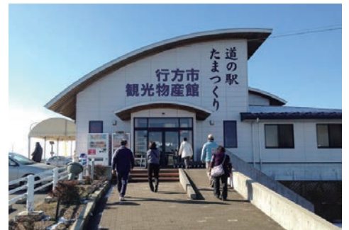
新鮮な野菜が魅力の道の駅「たまつくり」