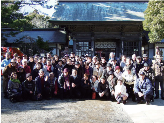
大洗磯前神社の境内にて参加者全員で記念撮影

再びバスに 乗って、大洗 磯前神社へは ほんの10分ほ ど。百段の 階段を登れる か心配だとい