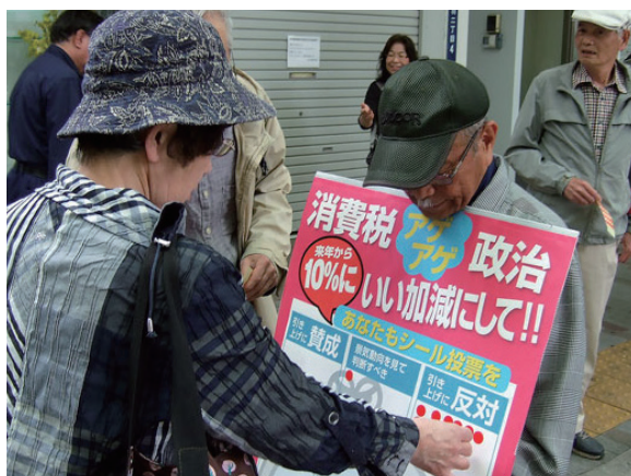
よびかけに応じてシールをはる通行人 =ララガーデン

5日、日本共産党志茂・赤羽後援会のみなさんとともに赤羽ララガーデンで、来年からの消費税10%増税についての是非を問う宣伝行動をおこないました。4月1日から税率が8%に引き上げられ、家計にも営業にも重い負担がのしかかっています。宣伝では、私が「黙っていたら来年10月から