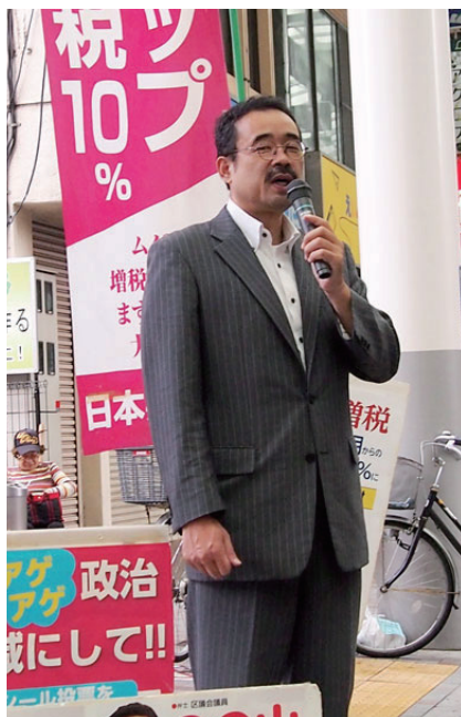
10%増税反対を訴える、のの山区議

政府が発表した9月の月例経済報告は、政府の景気判断を5カ月ぶりに下方修正し、4月増税後の落ち込みが長引いていることを認めました。7月以降、反動は「和らぎつつある」としていたのを撤回したのです。日本経済の変調は明