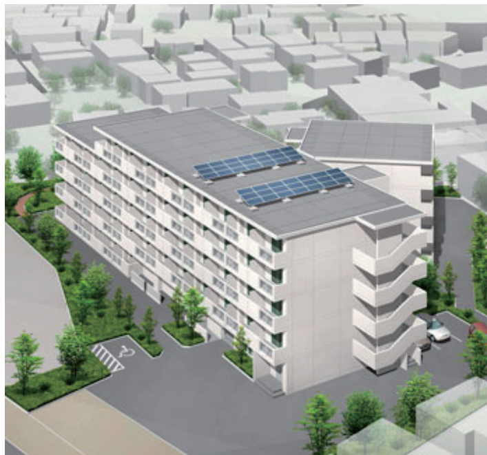
建設委員会に示されたブロックプランより、配置図(左)と外観イメージ図(右)。最高の高さは5階建て、総戸数は75戸になります。

北区は、借り上げ契約期間の満了が近づいているシルバーピア（単身者用高齢者住宅）について、契約が切れた後の居住者の移転先として、旧北園小学校跡地（赤羽北）に、北区で初となる区営シルバーピアの建設を予定しています。 今区議会の建設委員会には、新築計画図（ブロックプラン）が示され、その概要が明らかにになりました（上図参照）。 今後、10月に住民説明会、2015年度中に工事着工、入居（移転）開始は2017年8月からとなります。隣接地には、特養ホーム、保育園などが整備される予定です。