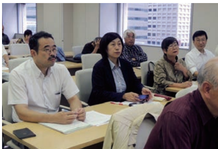
日本共産党北区議員団も参加しました