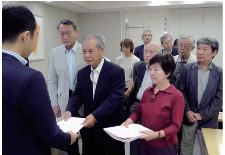
東京都に道路計画の撤回を申し入れる都内各地の住民代表

東京都が2020年までに100%完成させるとしている特定整備路線（都全体で28路線、北区では4路線）は、その多くが住環境破壊の道路計画であり、戦後直後に都市計画決定されたものの今日まで建設に至らず、事実上の廃止路線となっていたものです。