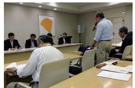
志茂86号線の撤回を訴える参加者

書と地域ごとの個別要請書、反対署名を都の担当者に手渡しました。 81・73・86号線の計画撤回を求める