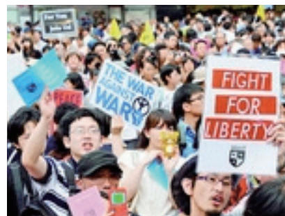
6月27日、SEALDs（自由と民主主義のための学生緊急行動）による「戦争法案に反対するハチ公前アピール街宣」