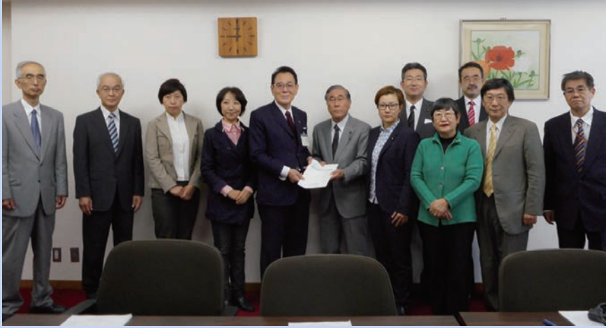
花川区長に要望書を手渡す日本共産党北区議員団と池内さおり衆院議員

日本共産党北区議員団と池内さおり衆院議員は19日、花川区長に2016年度予算編成に関する要望書を提出しました。区内で活動するさまざまな団体からのヒアリングを受けてまとめた9つの柱466項目の要望に、花川区長は「区民の切実な声と受けとめ予算編成で十分に検討したい」と答えました。(のの山けん)