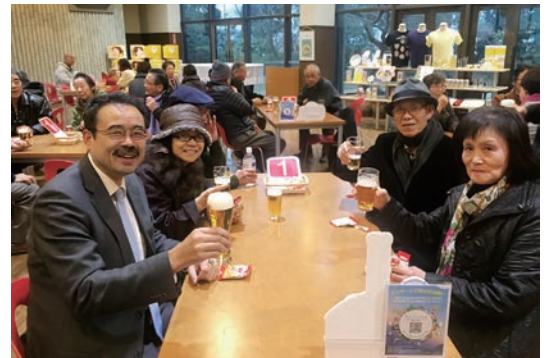
キリンビール工場で「二番搾り」の試飲

ですが、ローテーションの関係で食事会場には午後1時にならないと入れないとのこと。それまでの約1時間、お寺の周辺や出店などを見て過ごすことになりました。この機会を利用して、おみやげもどつかりと買い込みました。