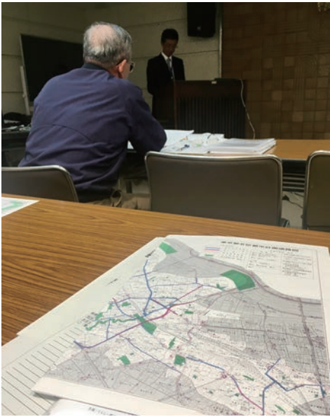
北区の事業計画説明会 = 15日、赤羽会館

東京都はこのほ ど「東京における都 市計画道路の整備方 針（第4次事業化 計画）（案）を発表、 北区は13日から15日 まで3カ所で説明会 を開きました。 赤羽会館での説明 会には、志茂、赤羽 西、十条などから多 数の住民が参加。新 しい優先整備路線は、 これまでの優先路線 を基本的に引き継ぐ とした区の説明に対 し、「高齢者が増え るのに道路ばかりつ