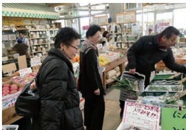
道の駅「やちよ」で買い物

広がりまして、さすが、全国トップ3に入る初詣のメッカ、1月もすでに半ばだといふのに参詣に来る人でごった返していました。午前11時すぎには到着したの