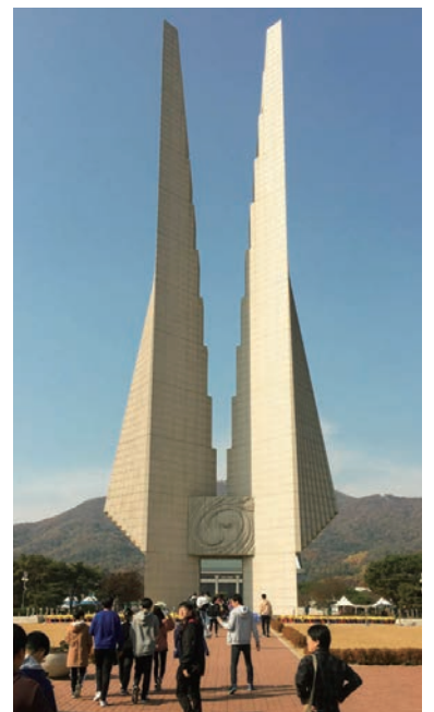
独立記念館入口に立つ「キョレの塔」

されている少女像は、侵略戦争の中で日本軍「慰安婦」とされた女性たちの象徴です。わずかに生存している元「慰安婦」当事者の意向を最優先にし