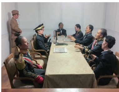
「保護条約」調印の場を模した展示

かいを、豊富な資料によつてつづつた施設。巨大な「キョレの塔」や「不屈の韓国人像」に、まず圧倒され、7つの展示館を駆け足でまわりました。一部に「これは『反日』記念館だ」との声もありますが、植民地支配の時代に日本軍が何をしたのかを知るには、「支配された側」からの視点で直視することが必要です。その意味で日本人こそ訪れるべき施設だと痛感しました。再訪の際は、もつと時間をかけて回りたいと思います。