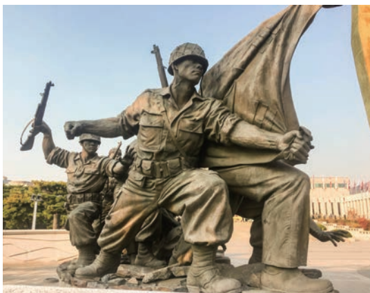
戦争記念館の朝鮮戦争象徴造形物

戦争記念館は、韓国が関わってきた戦争にまつわる歴史を伝える施設。この日は休館日でしたが、屋外の展示は自由に見学できました。目を引くのは民族を分断する悲劇となった朝鮮戦争に関する展