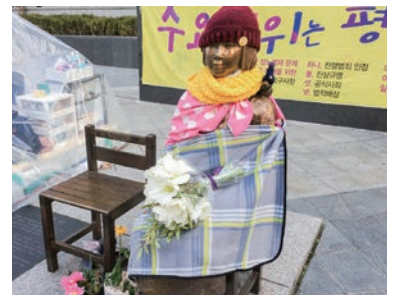
日本大使館前の少女像

戦争記念館は、韓国が関わってきた戦争にまつわる歴史を伝える施設。この日は休館日でしたが、屋外の展示は自由に見学できました。目を引くのは民族を分断する悲劇となった朝鮮戦争に関する展