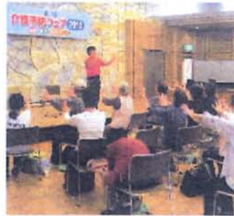
介護予防フェア2010（北区HPより）