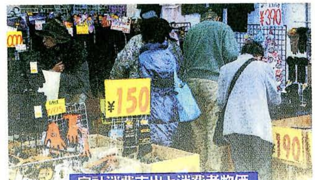
家計消費支出と消費者物価

(注)三菱UFJ＝三菱UFJフィナンシャルグループ、三井住友＝三井住友フィナンシャルグループ、日本電信電話の3社はいずれも持ち株会社です。(国公労連の内部留保活用による雇用増、賃上げ試算から)