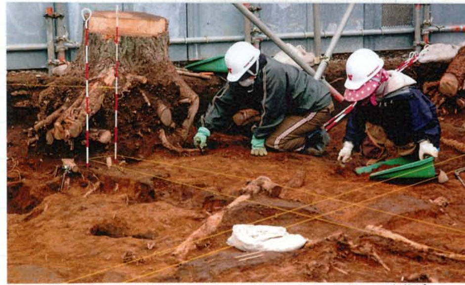
<1号住居址> 古代のもの(1万5000年前くらい)で、ていねいに作業中。

発掘現場の全体図は、裏面にあります。 見学会の写真は、4/13(土)の春のついでに展示したいと企画中です。