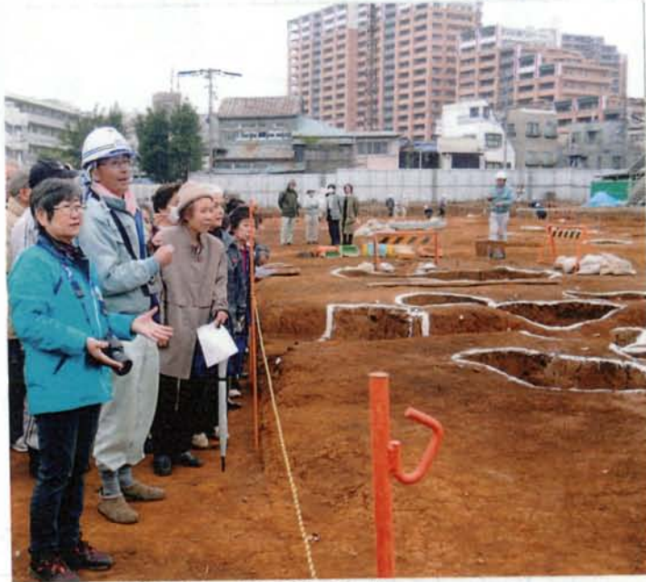
ヘルメットの方が、学年の五ヶ嵐。 ヘルメットの方が、学年の五ヶ嵐。