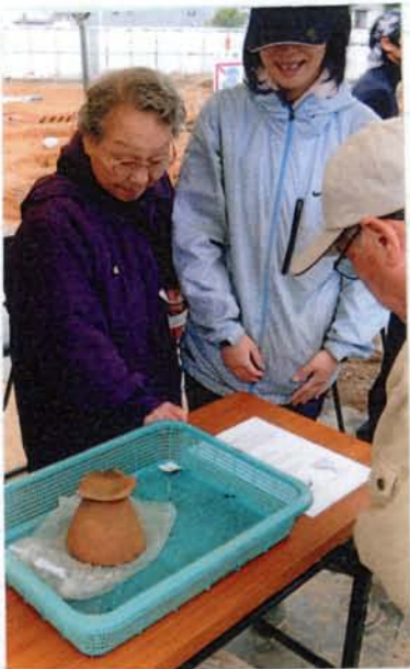
<概要> 弥生時代の土器