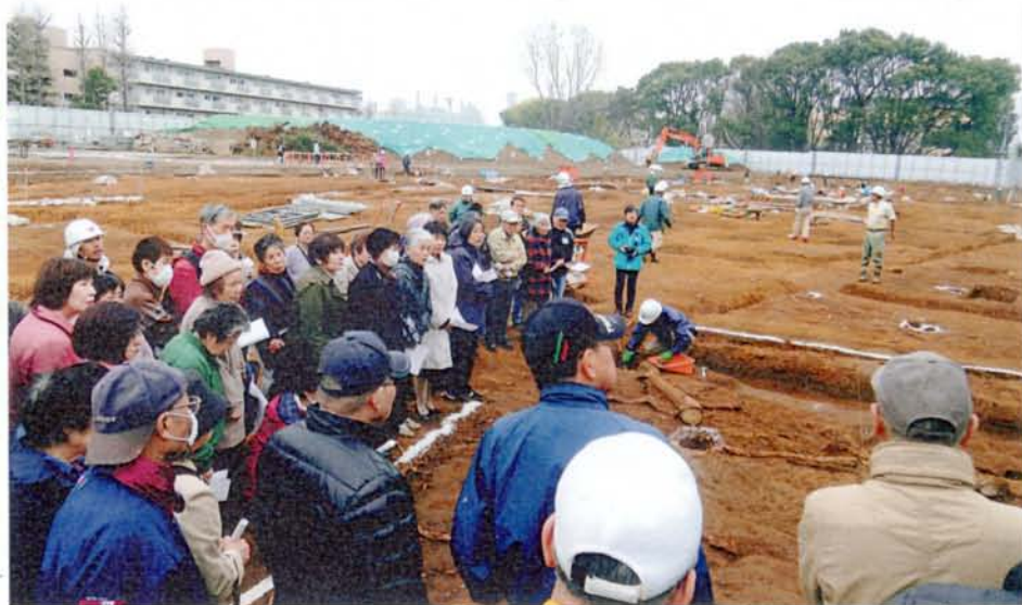
東京都埋蔵文化財センター 桐ヶ丘分室