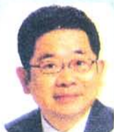
党政策委員長・ 副委員長