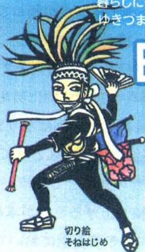
切り絵 そねはじめ