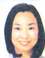
党都雇用と就活 対策室長