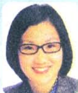
党衆院東京12区 青年部長