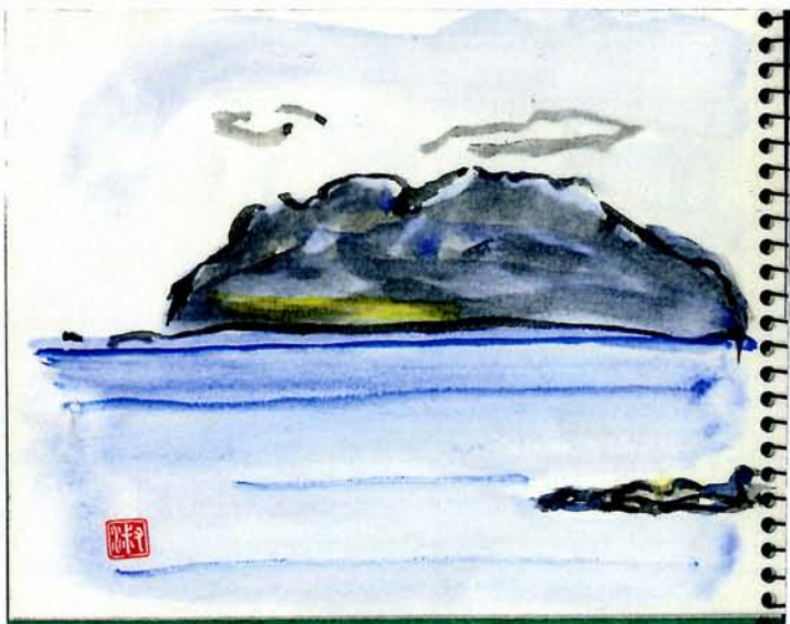
三宅島から御蔵島を描く 2013.夏

この7月だけでも、「熱中症で利用された方は15件です」と北区の担当課長。しかし、「エアコンがなければ、退院させるわけにゆかない」と相談が寄せられました。