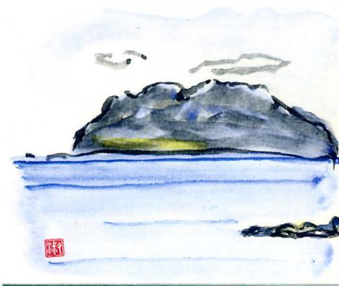
三宅島から御蔵島を描く 2013年夏