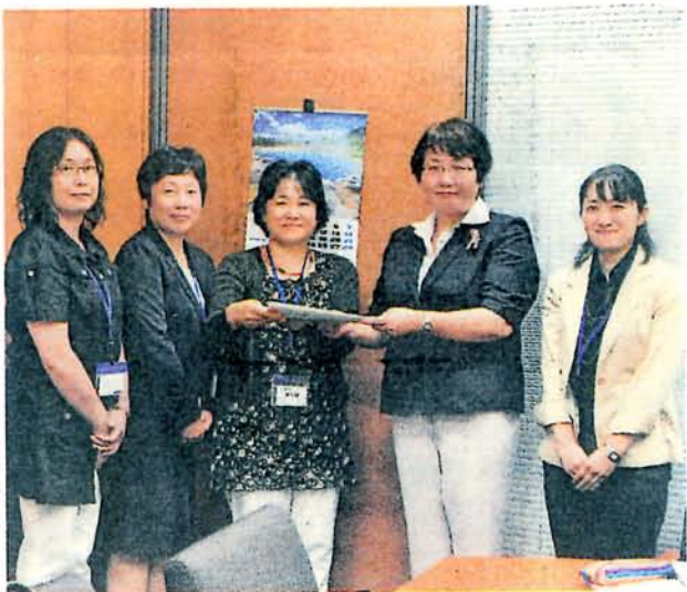
高橋衆院議員（右から2人目）に、消費税増税中止に向け、協力を要請する「くらしを考えるネットワークいで」の人たち=10日、衆院議員会館

来年4月からの消費税増税の是非について、安倍晋三首相は来月1日にも判断を下そうとしています。岩手、宮城、福島の被災3県