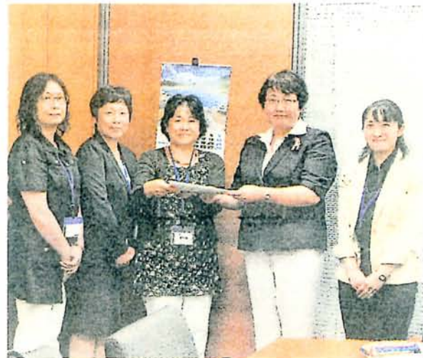
高橋衆院議員(右から2人目)に、消 費税増税中止に向け、協力を要請する 「くらしを考えるネットワークい て」の人たち=10日、衆院議員会館

秘密保護法案 軍事情報から原発まで幅広い行政情 報を統制するための法案。軍事、外交、安全 脅威活動の防止、テロ活動防止の4分野で、 行政機関の長が情報を「秘密指定」(特定秘密)。それ を漏えいした公務員や国会議員、民間業者を処罰し、 国民や報道機関などによる情報公開の働きかけも「教 唆」「共謀」などとして懲役5年〜10年の刑を科し取 り締まる内容です。