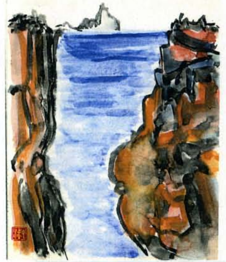
な雄山の噴火でマガネ岩も姿を変えてしまいました。向いに見えるは三岳。