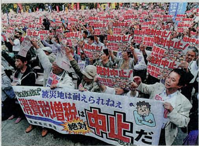
東京・日比谷で国民集会