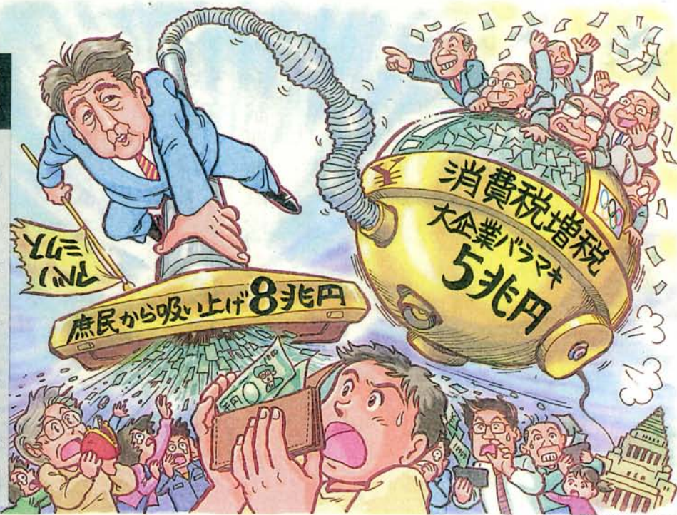
イラスト 井桁裕子