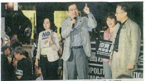
スピーチする志位和夫委員長（左から2人目）と（右から）笠井亮衆院議員、田村智子参院議員、吉良よし子参院議員=13日、国会正門前