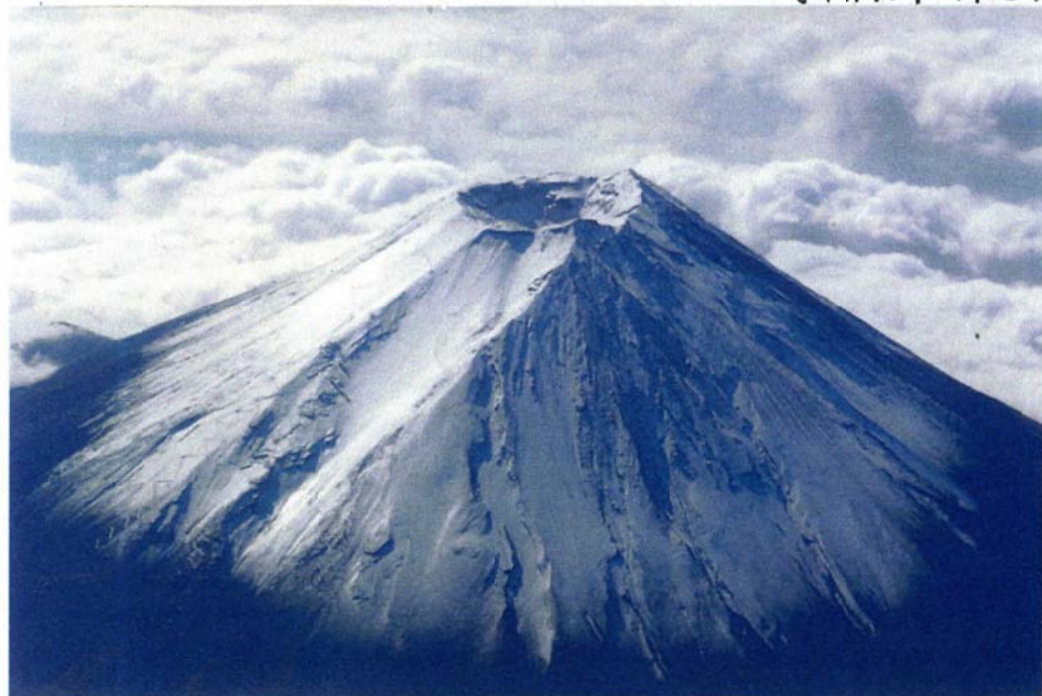
<飛行機の窓から1/31> 秘密保護法下では、この写真も撮れなくなり封ね。

■ 裏面には、赤羽台団地の次の建替計画の説明会資料をのせました。工事輸送ルートが課題です。