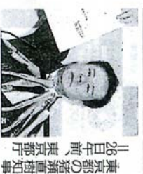
東京部の猪瀬直樹知事 赤羽 2013.11.25

●都知事は、7億円の都の補助金を受けている医療法人グループから副知事時代に資金提供を受けた。個人的に借りた金と言いは通じません。