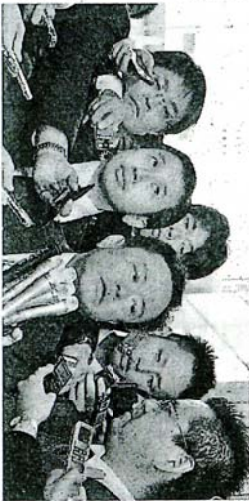
徳洲会から500万円受領したことを認めた猪瀬直樹都知事(中央)と猪瀬直樹都知事(右)が、後15分すぎ、都庁