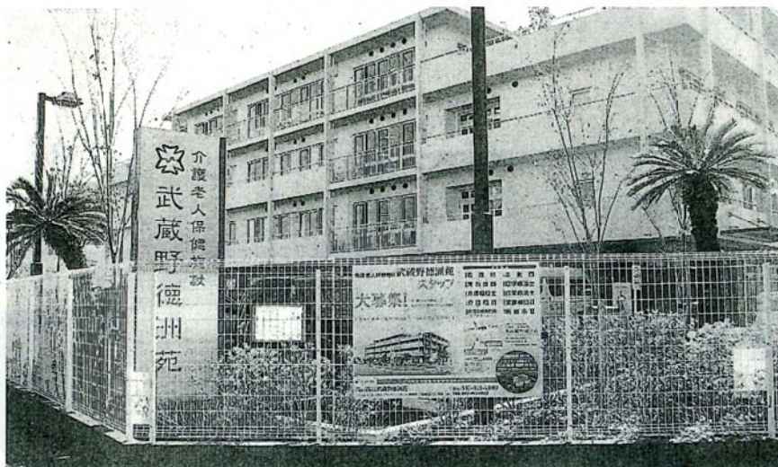
東京都から工事費約7億5000万円の補助金を受けた介護老人保健施設「武蔵野徳洲苑」＝東京都西東京市

1999年3月、石原氏 前夜に都内のホテルで会が都知事選に出馬表明する ついては相手は虎雄氏で