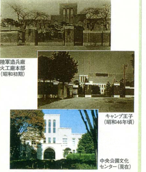
陸軍造兵廠火工廠本部(昭和初期)

豊かな緑に包まれた中央公園には、一棟の白い建物「中央公園文化センター」が建っています。この建物が見つめてきた歴史は、まさに「激動の昭和」そのものでした。 この建物は、昭和5年(1930)4月に、十条台一帯に広がっていた兵器工場である東京砲兵工廠銃包製造所(後の東京第一陸軍造兵廠十条工場)の本部事務所として建てられました。終戦により、旧軍用地が占領軍に接収されると、この一帯は、アメリカ軍の施設として使用されることになり、この建物も、アメリカ軍の保安司令部に始まり、技術情報センター、極東地図局、野戦病院(キャンプ王子)など、昭和46年に日本へ用地返還されるまで、さまざまな用途で使用されました。 返還後、この建物は大規模な改修工事が行われ、現在では、区民の生涯学習の場として、また、テレビドラマのロケ地としても頻繁に利用されるなど、新たな歴史を刻んでいます。