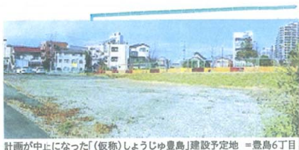
計画が中止になった「(仮称)しょうじゅ豊島」建設予定地 = 豊島6丁目

できる説明しています。しかし、介護報酬は処遇加算を含んでも2・27%のマインスです。小池氏は、介護報酬引き下げのしわ寄せが職員に及ぶ危険を具体的にあげて「処遇改善に逆行する」と迫りました。塩崎恭久厚労相は「約束通り（賃上げを）やっているかチェックしていく」としか答えられませんでした。小池氏は、政府が介護施設の収支差率（利益率）が良好だから介護報酬削減に