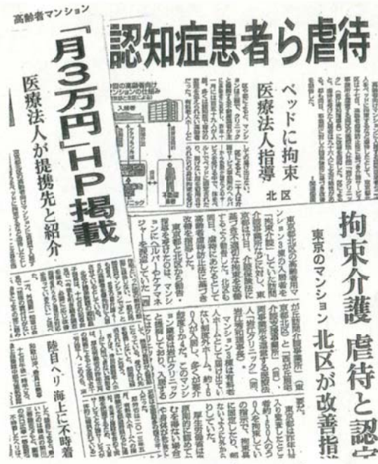
～ 2月17日の記者発表を報ずる2/18付各紙～

●先日の国会で、小池晃参院議員 が指摘げように、政府の介護報 酬制限方針によって、区内で221床の 持養ホーム建設計画が突然白紙になり ました。介護人材の不足も深刻さを増しています。 ●北区で900人もの方が、全国では52万人分の持 養ホームが足りません。こうした介護施設の圧倒的 な不足が、介護を必要とする高齢者の行状をうばっ ています。