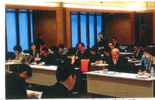
— 2015. 2. 12、衆議院会館で —