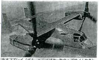
①オスプレイ