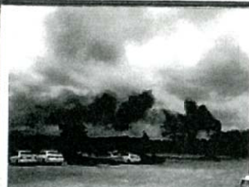
② 5月17日、米海兵隊の新型輸送機MV22オスプレイが、ハワイ・オアフ島で訓練中に着陸に失敗し、隊員12人が病院に搬送された。写真は事故現場から上がる黒煙。