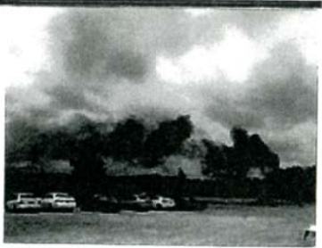
● 5月17日、米海兵隊の新型輸送機MV22オスプレイが、ハワイ・オアフ島で訓練中に着陸に失敗し、隊員12人が病院に搬送された。写真は事故現場から上がる黒煙。