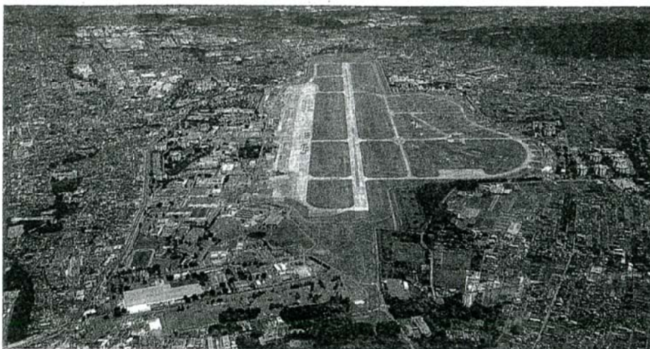
周辺に住宅が密集する米軍横田基地

●オスプレイ配備のねらいは、 ①特殊作戦部隊の拠点づくり ②低空・夜間訓練もせざるに